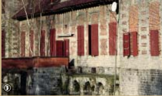
Ferme-château de Bercu

Dans la commune de Mouchin, village frontalier avec la Belgique, se trouvait une seigneurie, depuis le douzième siècle, dont la ferme-château de Bercu peut encore témoigner aujourd'hui.