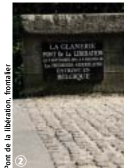
Pont de la libération, frontalier