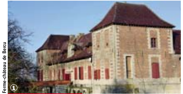
Ferme-château de Bercu